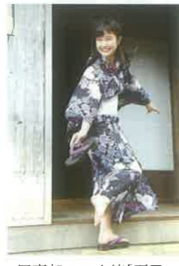
写真部 2-8 山崎「夏風」

写真部 佳作入賞者の作品も含めて、 高文連石狩支部写真展で 見ることができます。 日時: 10月3日(火)～5日(木) 会場: 札幌市民ギャラリー